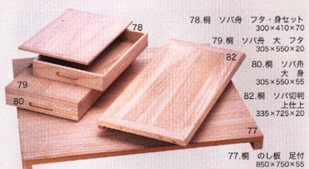
77.桐 のし板 足付 850×750×55 78.桐 ソバ舟 フタ・身セット 300×410×70 79.桐 ソバ舟 大 フタ 305×550×20 80.桐 ソバ舟 大身 305×550×55 81.桐 ソバ切刃 上仕上 335×725×20