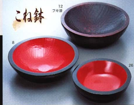
8.木製丸型コネ鉢黒内朱 ¥360×100 12.柄手彫コネ鉢黒内朱 ¥420×115 26.柄手彫コネ鉢黒内朱 ¥540×150