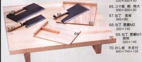
64.コマ板 桐 220×300×30 65.コマ板 桐 特大 300×350×30 67.包丁 音房 345×80 68.包丁 豊蔵M2 320×145 69.包丁 豊蔵M1 320×145 70.のし板 杉足付 800×700×125