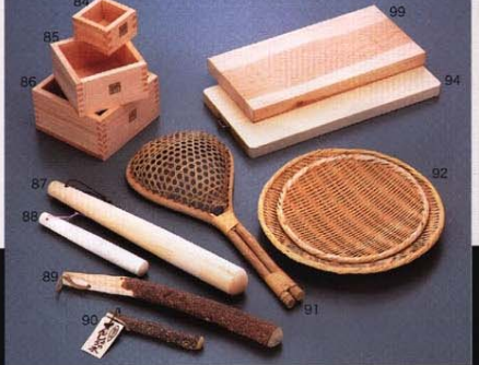
84.本松 一台マス 85×85×55 85.本松 五合マス 140×140×75 86.本松 一升マス 170×170×95 87.太口当り棒 クルミ 50×450 88.当り棒 8寸 クルミ 30×240 89.さんしょう スリ木 40×360 90.さんしょう スリ木 420×160 91.すいろう 450×200 92.苜蓿 2枚 ¥330×20 ¥300×20 94.林まな板 210×440×25 99.柳まな板 200×400×30