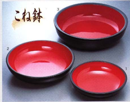
1.木粉コネ鉢黒内朱尺二 ¥360×90 2.木粉コネ鉢黒内朱尺五 ¥460×110 3.木粉コネ鉢黒内朱尺八 ¥540×150

◆当店で初心者の方からそば内体験も実施いたします。そば粉・そば道具・たれに関すること何でもご相談ください。