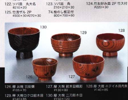
126.柳 お椀 羽反蝶 ¥105×70 127.柳 大椀 総木目輝彫 ¥130×80 128.柳 大椀 ホアイ木目内朱 ¥140×85 129.柳 大椀 口ろ総木目 ¥140×85 130.柳 大椀 二刀彫木目 ¥150×120