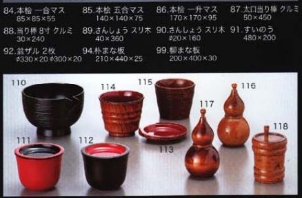
110.柳 片口 黒 135×115×85 111.タレ 椀 薬味皿朱 ¥81×68 112.タレ 椀 薬味皿黒 ¥81×68 113.柳 薬味皿木目内朱 ¥85×10 114.柳 ソバちよこ段付木目内朱 ¥85×70 115.柳 ソバちよこ千筋木目 ¥80×60 116.柳 ひょうたん薬味入 ¥55×110 117.柳 ひょうたん薬味入 ¥55×110 118.柳 タレ型薬味入 ¥60×75