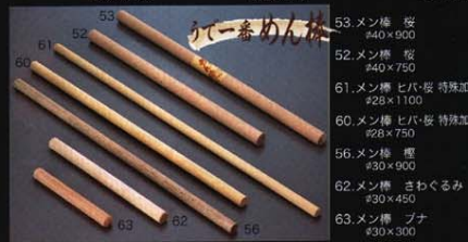
53.メン棒 桜 ¥40×900 52.メン棒 桜 ¥40×750 61.メン棒 セバ・桜 特殊加工 ¥28×1100 60.メン棒 セバ・桜 特殊加工 ¥28×750 56.メン棒 樺 ¥30×900 62.メン棒 さわくろみ ¥30×460 63.メン棒 プナ ¥30×300